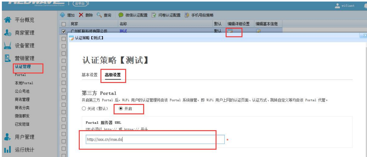
配置白名单：（添加第三方域名白名单）